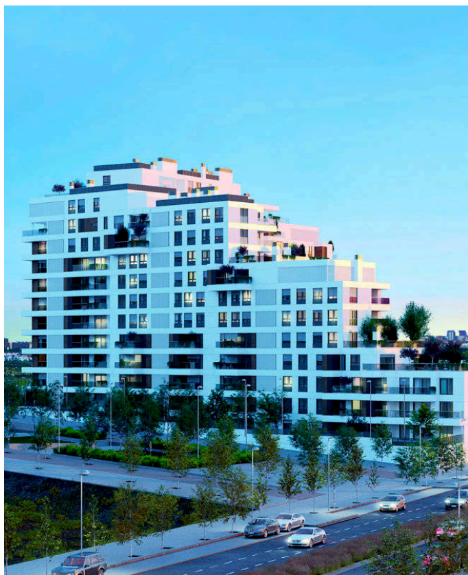
Así será Residencial Inbisa Valdebebas III, una vez concluida su construcción.